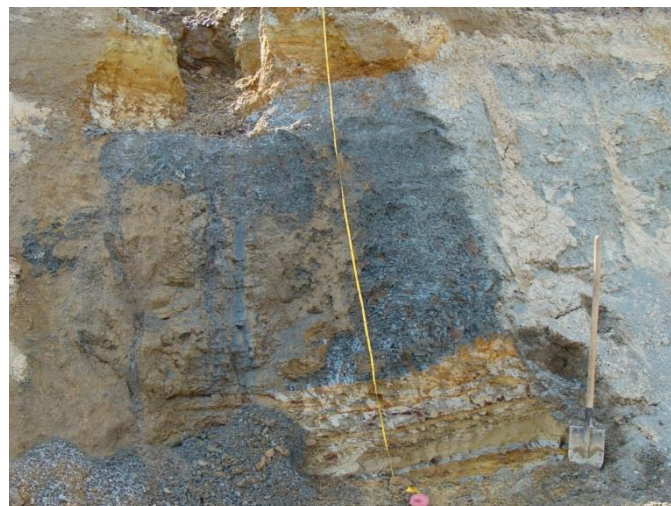
Рис. 3. Прослой «синих глин» в палеогеновых красноцветных отложениях Танхойской тектонической ступени на правобережье р. Мишиха.