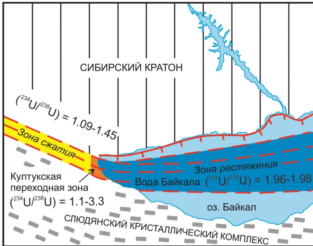
Рис. 1. Переход шовной зоны между Сибирским кратоном и слюдянским кристаллическим комплексом от сжимающегося фрагмента Главного Саянского разлома к растягивающемуся фрагменту под Южно-Байкальской впадиной. Переход регистрируется резким возрастанием отношения активностей ( ^{234}\text{U}/^{238}\text{U} ) в подземных водах и в глубинной воде Южного Байкала.

Одним из аргументов в пользу такой интерпретации служит систематика отношения активностей ( ^{234}\text{U}/^{238}\text{U} ) и ^{87}\text{Sr}/^{86}\text{Sr} трещинных вод из тектонитов шовной зоны в районе пос. Култук (Рассказов и др., 2015), из которой следует, что резервуар воды Южно-Байкальской впадины генетически связан с подземными водами, циркулирующими под ней в шовных милонитах, и существенно отличается от подземных вод, циркулирующих в породах сопредельных территорий Сибирского кратона и слюдянского кристаллического комплекса.