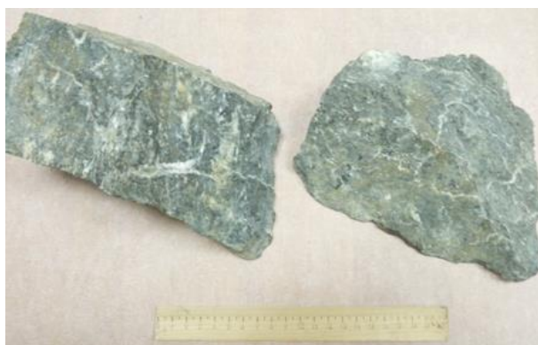
Рис. 4. Милонит из шовной зоны (район пос. Култук) – исходный материал для «синих глин».

Мы предполагаем, что слои «синих глин» представляют собой продукты размыва милонитов из Южно-Байкальского фрагмента шовной зоны Сибирского кратона (рис. 4). Своеобразная окраска глин находит объяснение в идентификации отложений этого типа только в разрезах Прихамардабанской ступени и дельты р. Селенга. До района Баргузинской впадины шовные милониты не распространялись, поэтому «синие глины» в основании разреза отложений Приикатского блока отсутствуют.